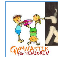
GYMNASTIK für SENIOREN